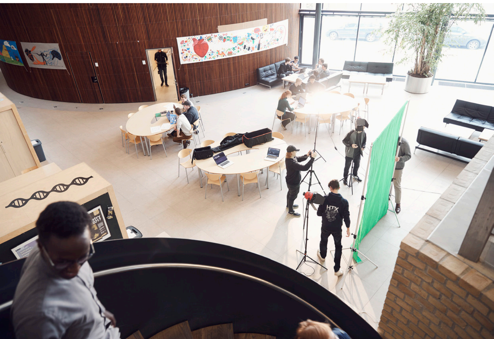
Elever i gang med at filme i det store fællesrum på HTX i Randers.