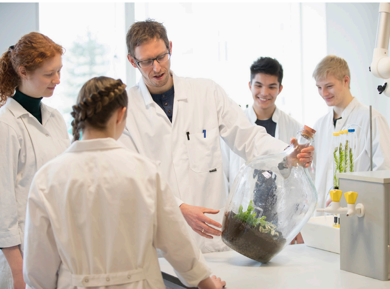
Elever i en undervisningssituation.

- Elitesport: Vi talte med nogle stykker, der går i elitesportsklasserne på Randers Realskole. Her har det en betydning, at HHX og Paderup Gymnasium har deciderede sportsklasser og samarbejde med Team Danmark. Enkelte italesatte, at de gerne vil fortsætte i en elitesportsklasse.