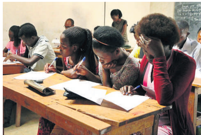
I flygtningelejren Kizibi i Rwanda modtager studerende undervisning. Kizibi er landets ældste flygtningelejr, og der bor mellem 16.000 og 17.000 flygtninge, der primært kommer fra DR Congo.

- Vi har et helt andet kendskab til det generelle trauma-