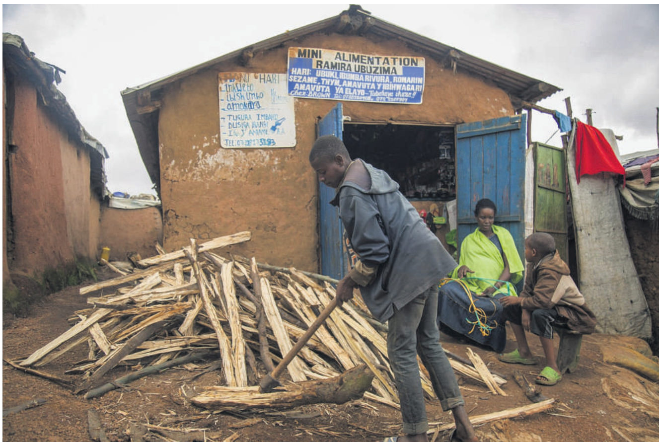
Flygtningelejren Gihembe i Rwanda huser over 12.000 congoleisiske flygtninge. Når Danmark tager imod congoleisiske kvoteflygtninge, får de en helbredsundersøgelse i Rwanda før afrejse.

Der er flere grunde til, at de på Indvandrermedicinsk Klinik oftere henviser til trauma-